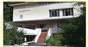
新城市鳳来寺山自然科学博物館